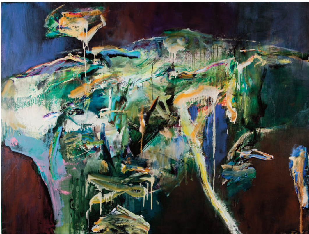
Chuang Che, Abandoned Garden , 2005, huile et acrylique sur toile, 126 x 167 cm