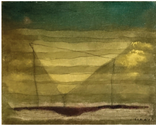
Josef Sima, Paysage ligne violette , 1965, huile sur toile, 24 x 19 cm

Au côté des œuvres contemporaines de nos cinq artistes, viendront ponctuer l'ac-crochage, des tableaux et dessins modernes qui respirent la nature et le naturel. Ainsi, seront présentées des œuvres de Chuang Che (1934), Olivier Debré (1920-1999), Pierre Dmitrienko (1925-1974), Jacques Germain (1915-2001), Ida Karskaya (1905-1990), Roberto Matta (1911- 2002, Louis Nallard (1918), Jacqueline Pavlowsky (1921 - 1971), Josef Sima (1891 - 1971).