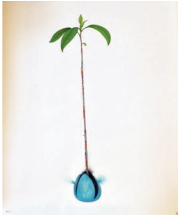
SUN Xue, Avocat, 2014 aquarelle sur papier, 76 x 58 cm

Des visuels sont disponibles auprès de la galerie.