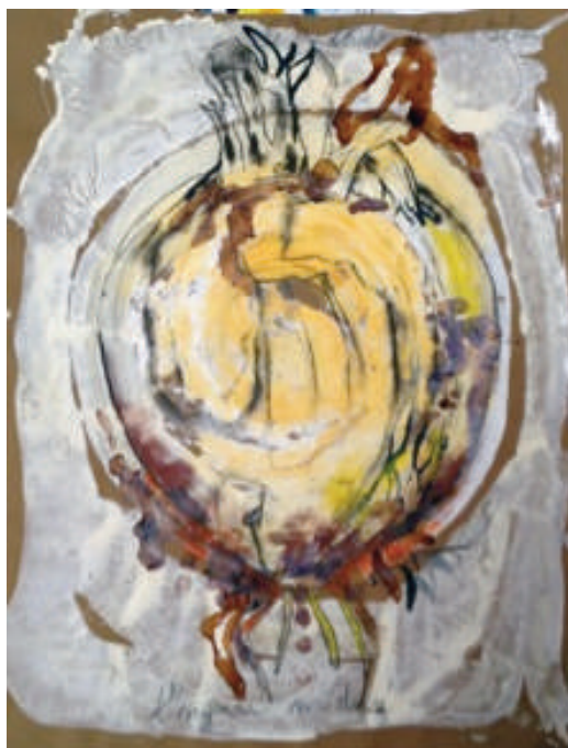
Michel Pelloille, Papier peint (Oignon)