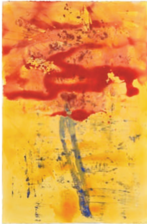
Anne Slacik, Pourpre , 2016

Huile et pigment sur velin d'Arches, 120 x 80 cm