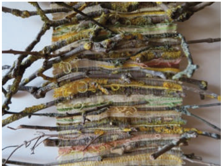
Marie-Noëlle Fontan, Lichen , 2016, 88 x 50 cm (détail)