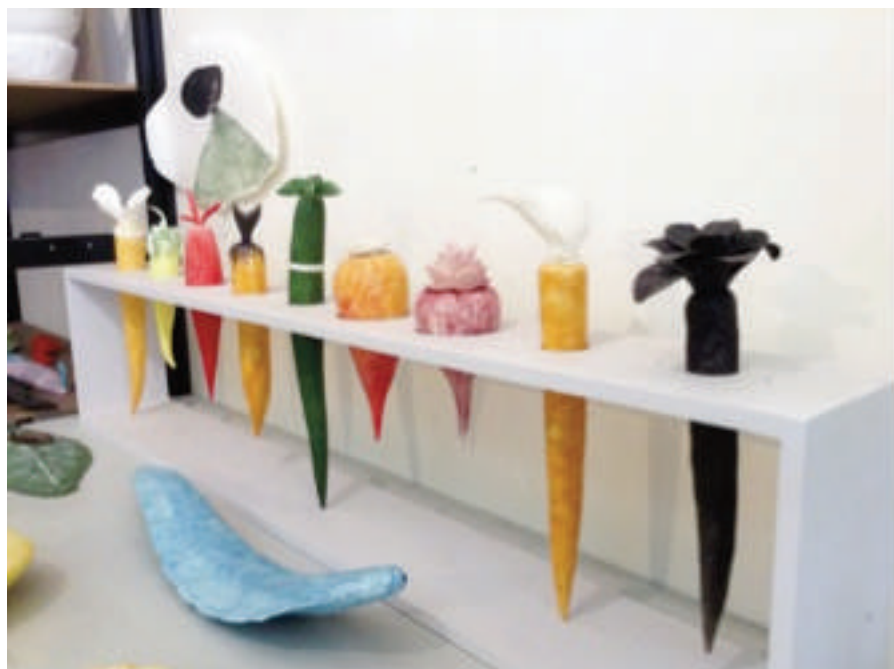
SUN Xue, Carottes , 2014, porcelaines, 12 x 21 x 100 cm

SUN Xue fait fi de la réalité scientifique. À cette vie "complète", elle préfère s'inventer des histoires et des processus créatifs inédits. " J'ai vu comme ça, et c'est arrivé ", dit-elle simplement. Elle traque la transformation, la mutation, l'hybridation, la transfiguration ou l'incarnation des formes, tour à tour, animales, végétales et minérales. Sa peinture et sa céramique produisent magistralement une poésie plastique subtile, délicate et rigoureuse.